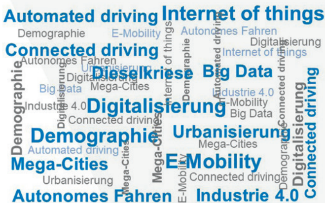
Geschäftsplanung bei unsicheren Erwartungen

Bei der Beantwortung dieser Frage spielen die internen Fähigkeiten und Ressourcen des Unternehmens ebenso wie die externen, nationalen und globalen Entwicklungen eine große Rolle. Es stellt sich beispielsweise die Frage, ob die eigenen Produktionsanlagen aktuell und langfristig die effizienteste und beste Lösung darstellen. Um das beantworten zu können, müssen einerseits die eigenen verfügbaren personellen und finanziellen Möglichkeiten eingeschätzt werden. Andererseits müssen aber insbesondere auch die sich stark verändernden, globalen Entwicklungen z.B. der Digitalisierung, der Elektromobilität, des autonomen/ vernetzten Fahrens, des Ausbaus erneuerbarer Energien, der Urbanisierung, um nur einige Bereiche zu nennen, berücksichtigt werden. Auch die Frage nach den zukünftigen Produktionsstandorten im Rahmen der Globalisierung ganzer Lieferketten verlangt weitreichende Entscheidungen, welche in dem für Unternehmen sich aktuell stark verändernden, unsicheren Umfeld häufig nicht ganz einfach getroffen werden können.